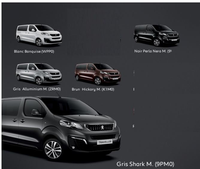
Blanc Banquise (WPP0)