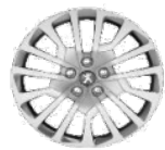
Колпаки штампованных стальных дисков 16" MIAMI