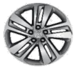
Литые алюминиевые диски 17" CURVE